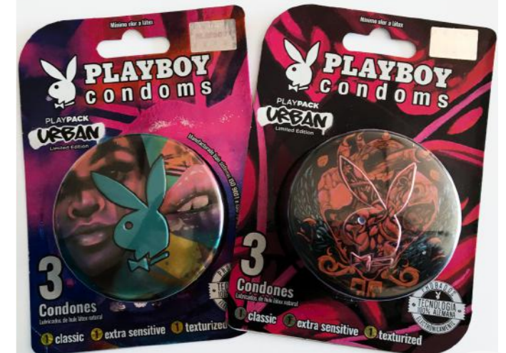
Play Boy Condoms