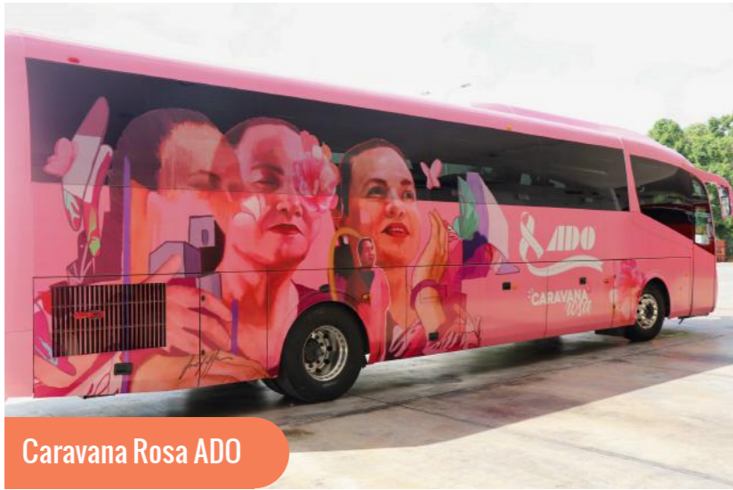
Caravana Rosa ADO