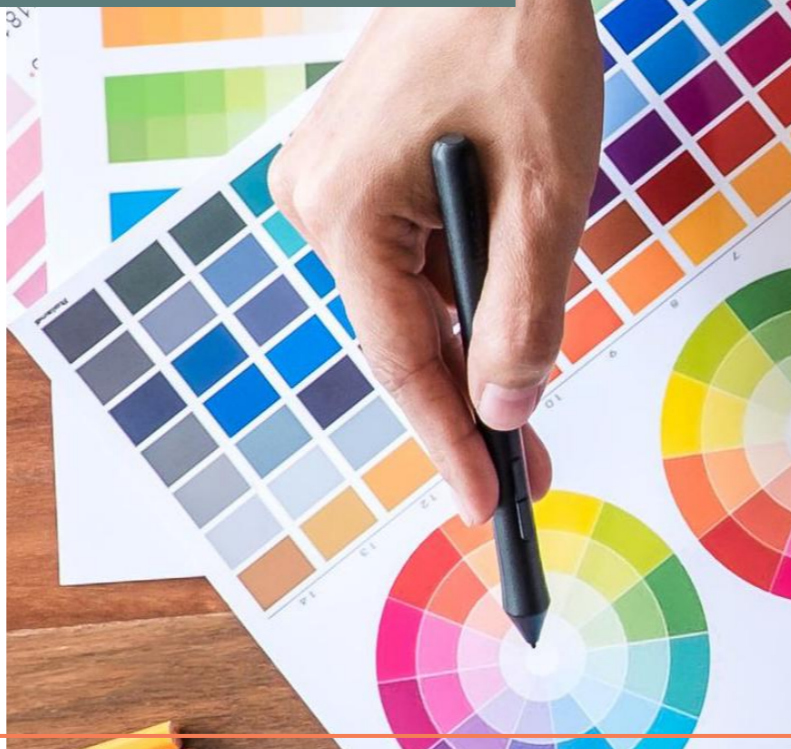
Coordinación y selección de colores